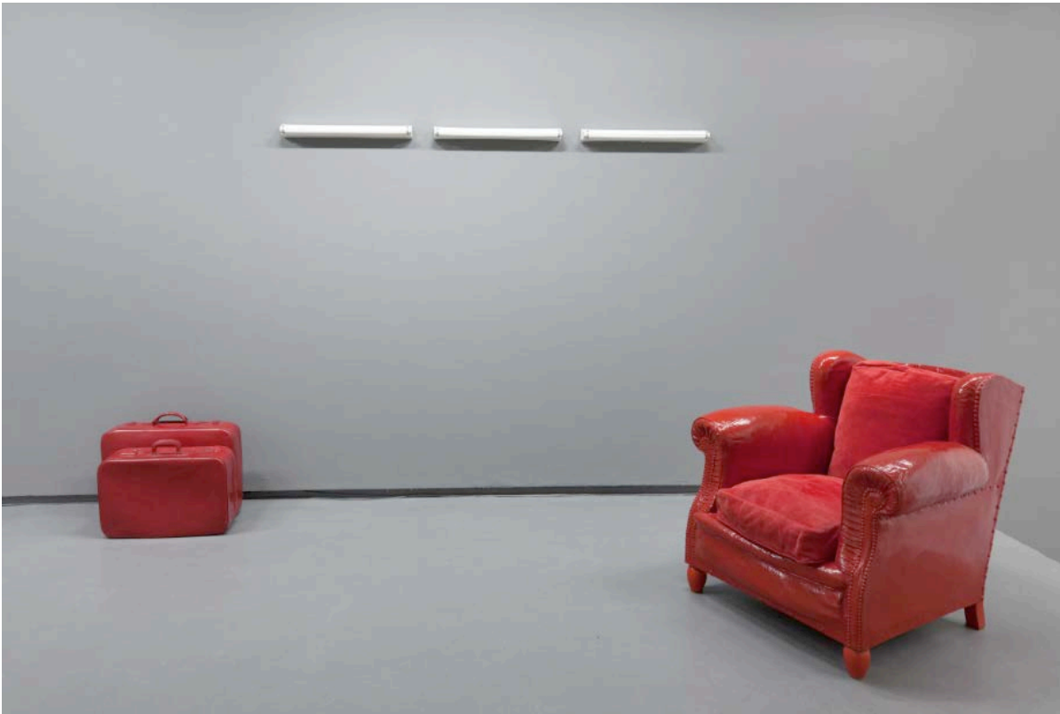
Vue de l'exposition "Etienne Bossut - Oeuvres des années 70-80".

Contact : Samuel Monier - s.monier@dole.org