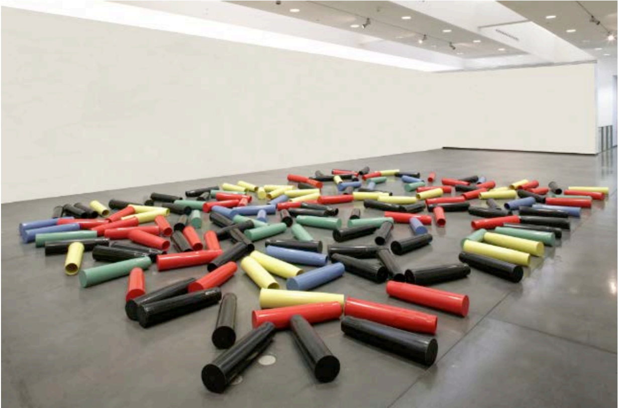
Carpet Bombing , 2005

© Courtoisie de l'artiste / MAC VAL, musée d'art contemporain du Val-de-Marne, cl. Jacques Faujour