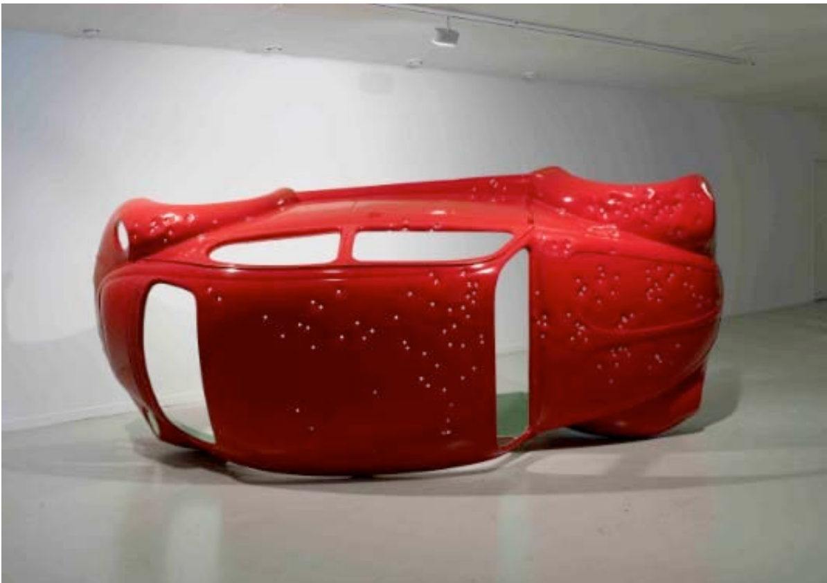
Pas ce soir, 2007 © Courtoisie de l'artiste