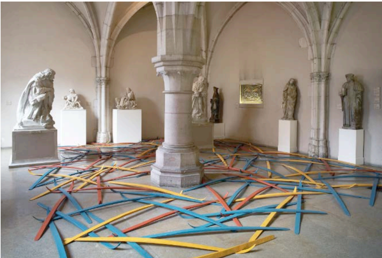
101 skis , 1995