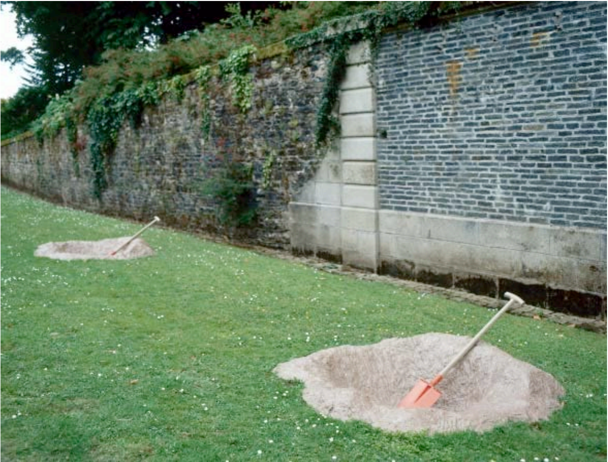
Jardinage , 1984

© Courtoisie de l'artiste / Frac Bretagne, cl. Hervé Beurel