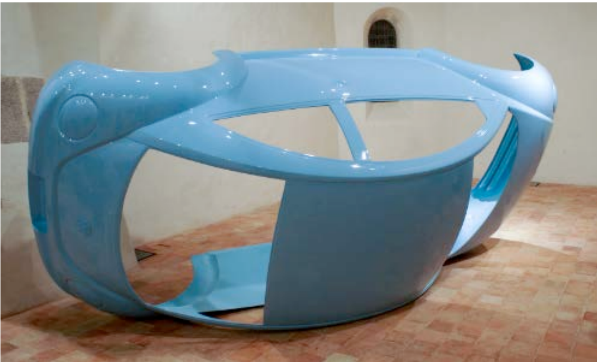
New... , 1998-99