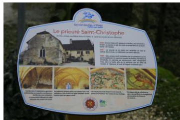
Cl. J.-P. Gantier