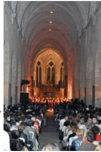
CL ; B. Lyet