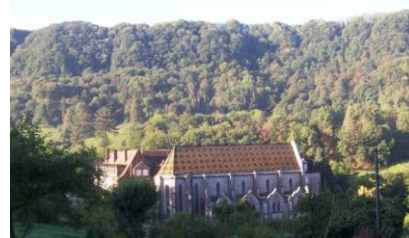
Cl. Amis de Vaux

Office de Tourisme. Place des Déportés, 39800 POLIGNY Tél : 03 84 37 24 21 tourisme.poligny@wanadoo.fr