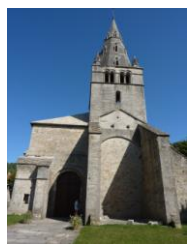
Cl. B. Poitou

info@tourisme-paysdedole.fr www.tourisme-paysdedole.fr