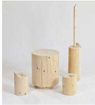
Sièges d'appoint et tables Pose ' Nature | Benoît Jaillet

Les coulisses se dévoilent... les artisans aussi !