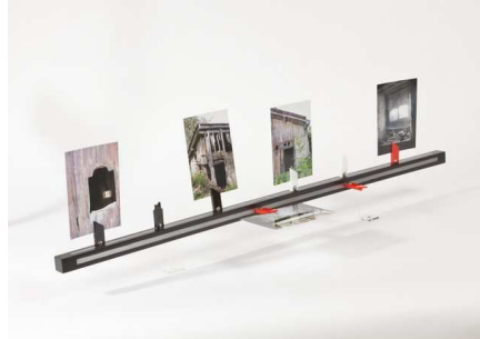
Izifoto | Martine Dotto © Jean-Marc Baudet

Pour la scénographie : des stands individuels pour un effet « showroom ».