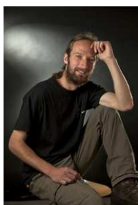
Cyril Micol Maître-verrier