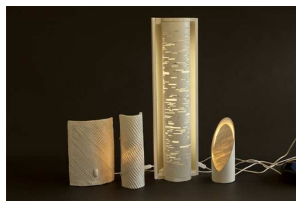
Luminaire en porcelaine translucide | Raymond Guibert © Jean-Marc Baudet