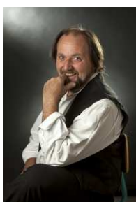
Jean-Marc Fassel Artiste sculpteur et fondeur d'art