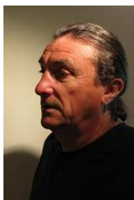
Raymond Guibert Potier