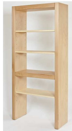
M.O.B | Claude Gros