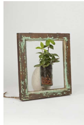
Vitrail végétal | Cyril Micol © Jean-Marc Baudet