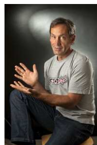
Benoît Jaillet Sculpteur