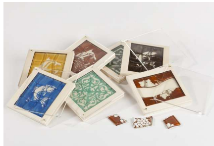
Zzle ? | Cyril Micol © Jean-Marc Baudet