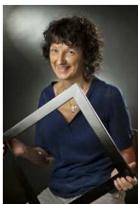
Martine Dotto Encadreur d'art © Jean-Marc Baudet