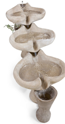
Mémeau | Jean-Marc Fassel © Jean-Marc Baudet