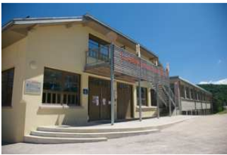
© G. Benoît à la Guillaume