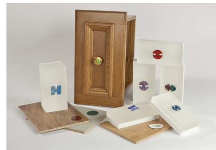
Boutons de porte et boutons pour la confection en émail | Dominique Morelli