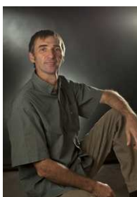
Claude Gros Ebéniste