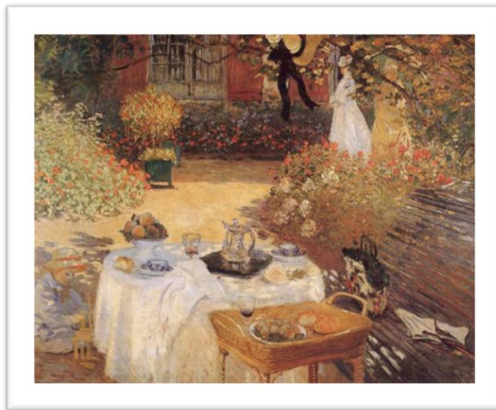
« Le déjeuner » 1873 – huile sur toile – 160/201 cm. Claude MONET -Musée d'Orsay, Paris

Après avoir réalisé un certain nombre d'études d'après nature, les peintres anciens travaillaient en atelier. Ils composaient leur tableau à partir d'éléments empruntés à des endroits divers, afin de montrer de nombreux aspects de la nature. Le paysage était alors une sorte de résumé idéal du monde où l'on mettait en scène une histoire. Dans la deuxième moitié du XIXe siècle, les artistes ont commencé à peindre complètement en plein air, ce qui était désormais possible grâce à l'invention des peintures en tube, plus facilement transportables...Leurs tableaux rendent également compte de l'évolution des mœurs : on sortait plus facilement de chez soi, on prenait le train, on allait au bord de la mer... Les conséquences de la peinture en plein air pour le sujet et l'apparence des images ont été radicales. Les tableaux se sont attachés à la représentation de choses banales, celles que chacun peut effectivement voir n'importe où et n'importe quand dans la réalité. Travaillant en pleine lumière, les peintres ont éclairci leur palette. Soumis aux changements continuels du temps, ils ont traduit les perceptions passagères, imprécises, par une technique se rapprochant de l'esquisse.