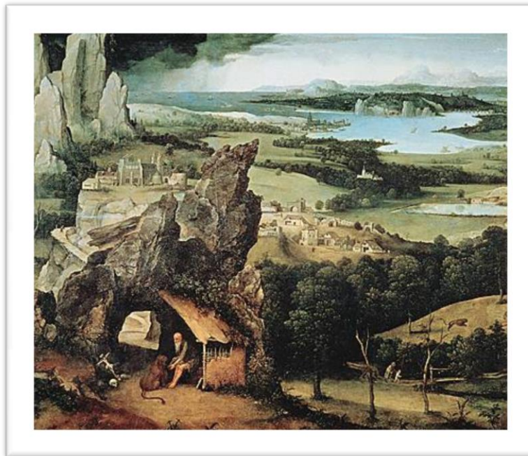
« Saint-Jérôme dans un paysage » 1520 huile sur bois – 74/91 cm Joachim PATINIR - Musée national du Prado, Madrid, Espagne

La deuxième moitié du XIII e siècle a vu l'apparition d'éléments extraits de la nature (un arbre, une montagne, un jardin) dans les tableaux. Ces motifs, qui n'avaient pas un but descriptif, servaient à situer l'histoire ou le personnage représenté. Progressivement, le répertoire s'est élargi : derrière les scènes sacrées, de véritables fonds de paysages ont fini par investir l'espace. Au XVI e siècle, la nature a si bien envahi les compositions religieuses que celles-ci ne montrent plus que de tous petits personnages évoluant dans un vaste décor. A partir du XVII e siècle s'est développé l'art du paysage proprement dit. Ce n'était plus le décor d'un autre sujet, mais véritablement un thème autonome. Dès lors, on n'a plus cessé d'en peindre, en choisissant des motifs de plus en plus proches du quotidien, surtout au XIX e siècle.